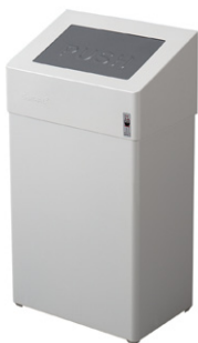
DAN DRYER Abfallbehälter Freistehend oder für Wandmontage Fassungsvermögen: 18 l Art. Nr. 1111 – weiß pulverlackiert Art. Nr. 1110 – Edelstahl gebürstet