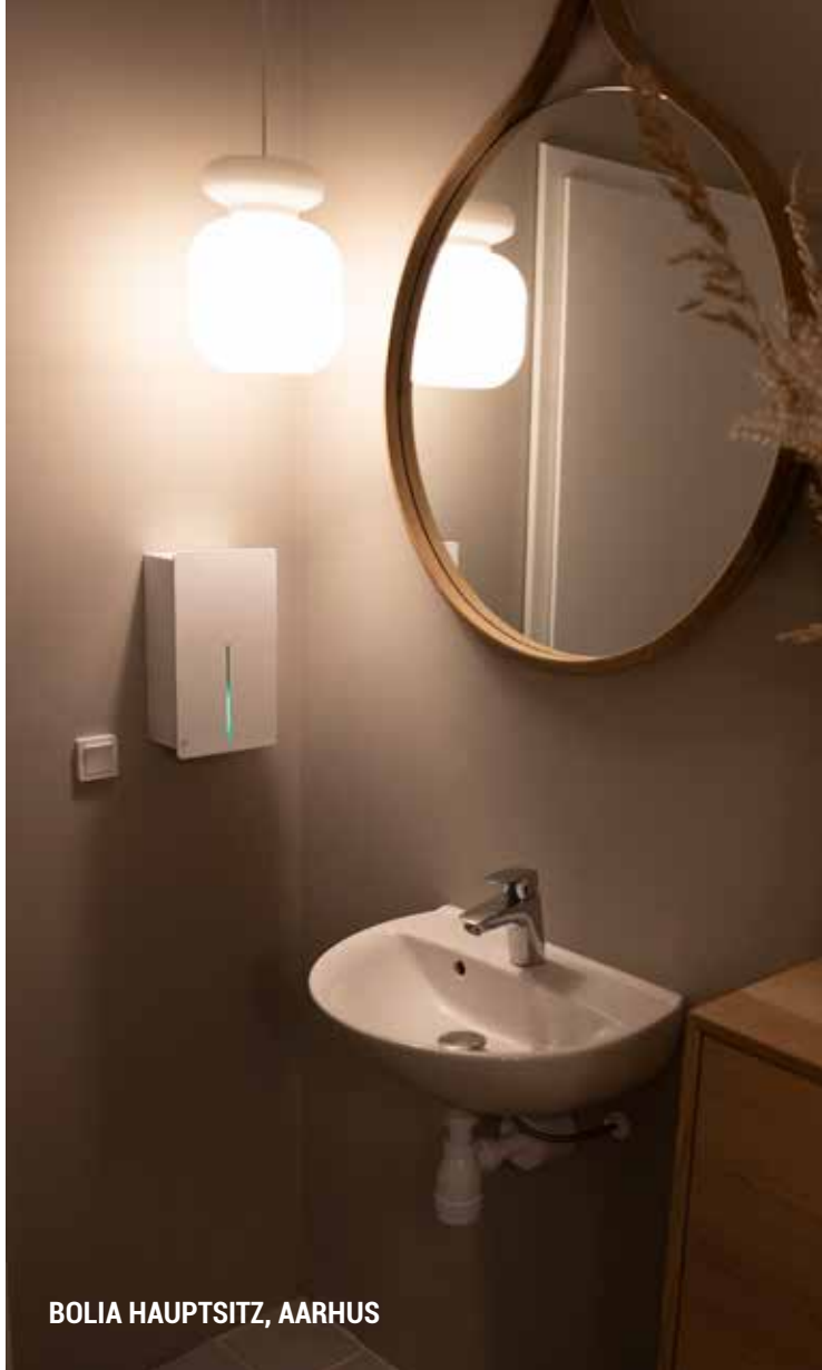
BOLIA HAUPTSITZ, AARHUS