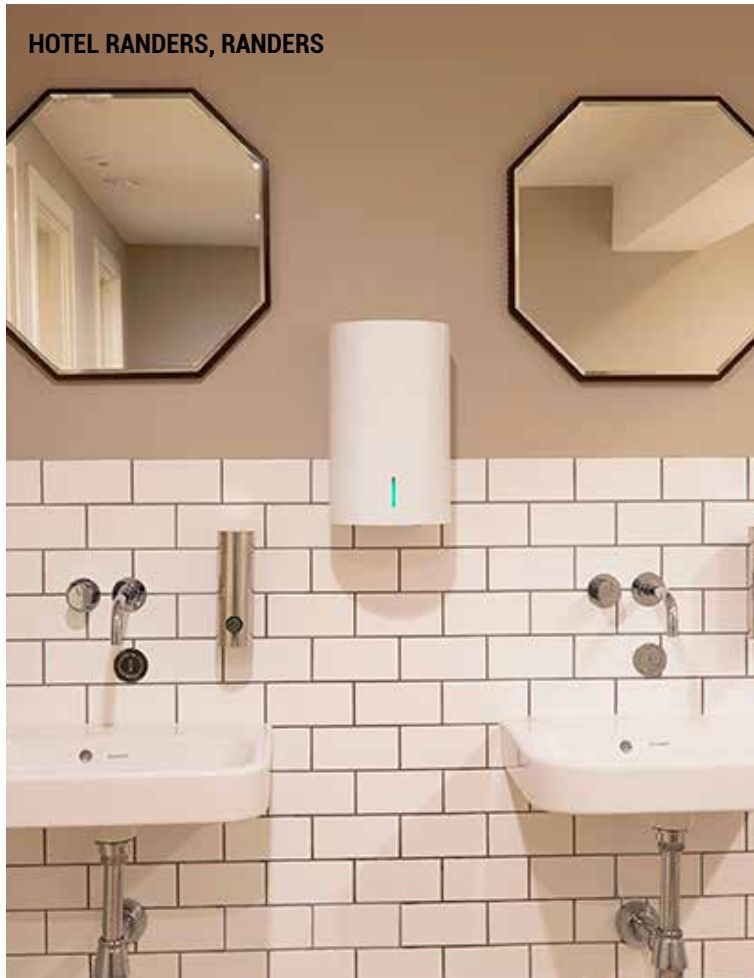
HOTEL RANDERS, RANDERS