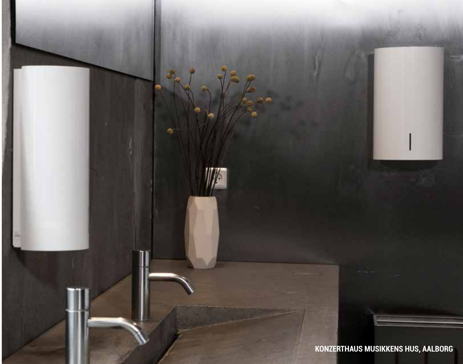
KONZERTHAUS MUSIKKENS HUS, AALBORG