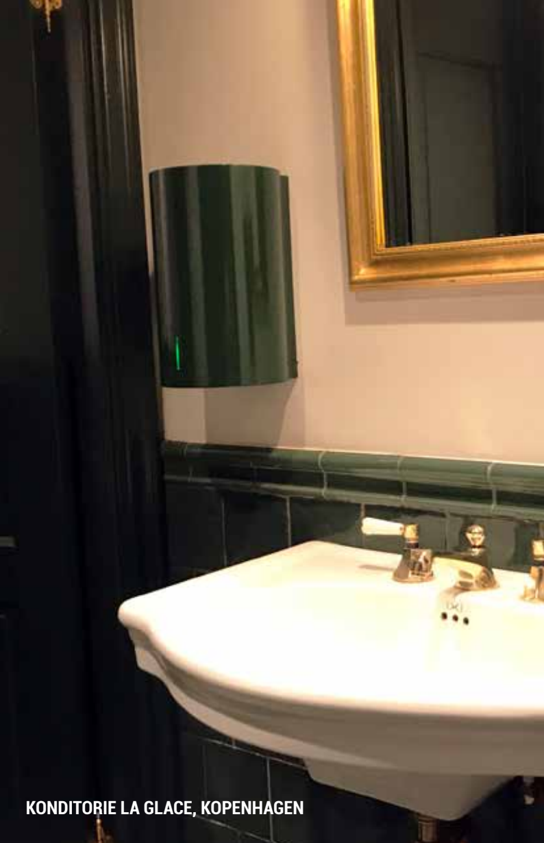
KONDITORIE LA GLACE, KOPENHAGEN