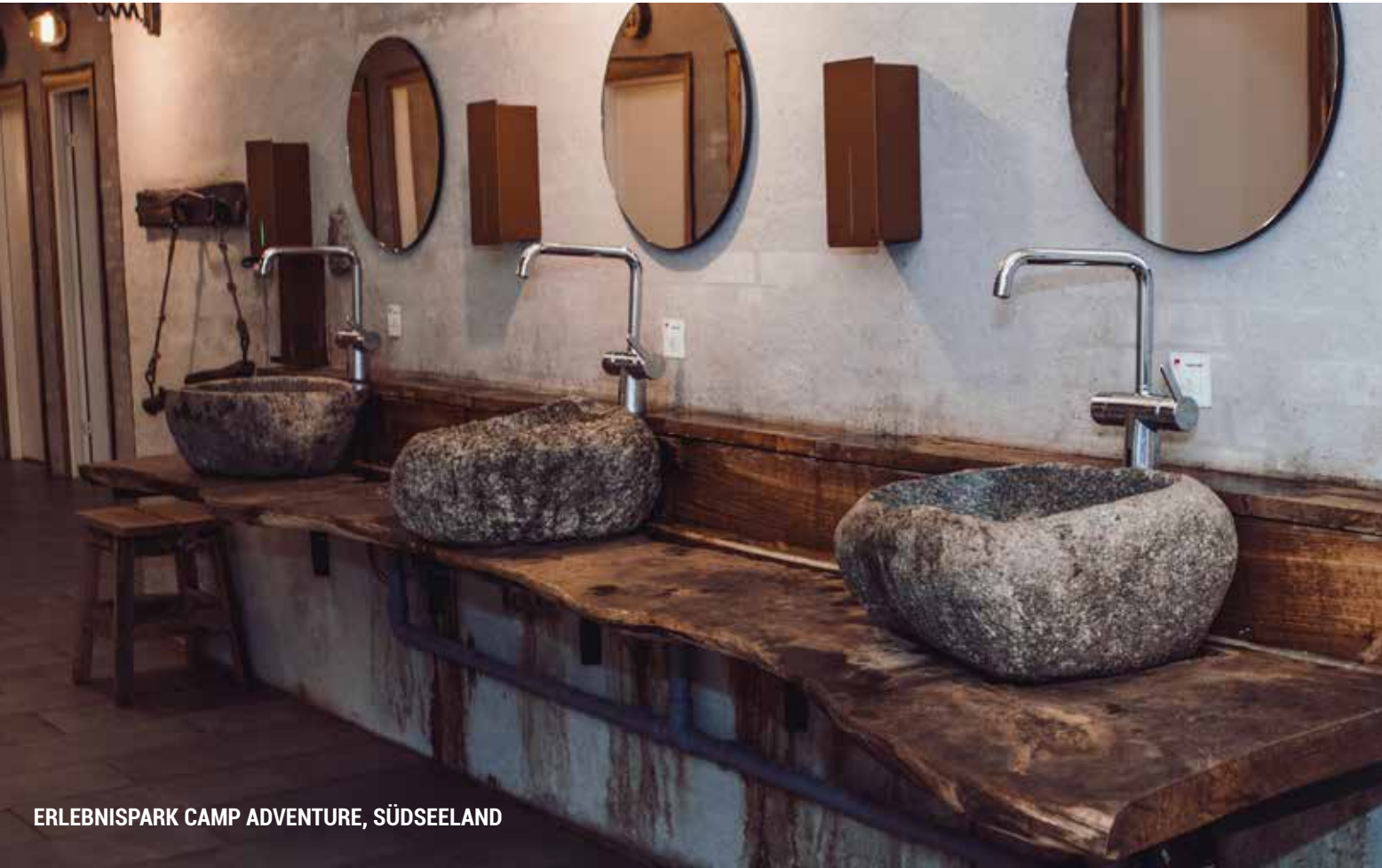
ERLEBNISPARK CAMP ADVENTURE, SÜDSEELAND