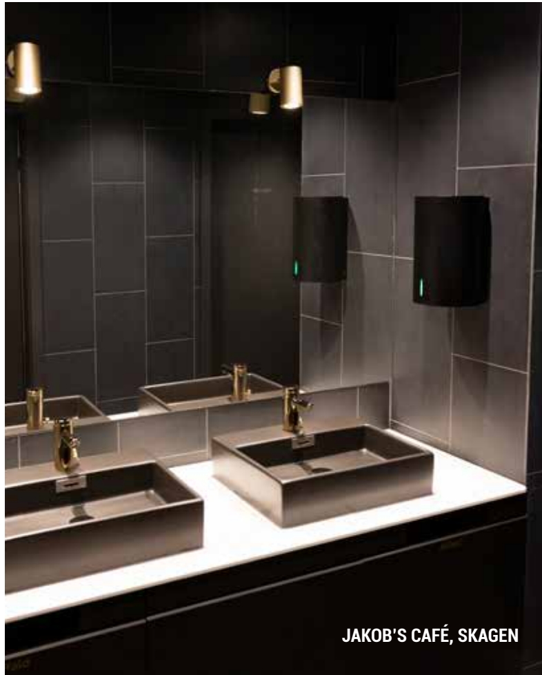
JAKOB'S CAFÉ, SKAGEN